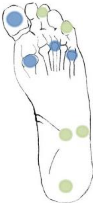
Abb. 2: geeignete Untersuchungsstellen

Die vier im Minimum an der Fusssohle zu testenden Stellen (pro Fuss) sind in der unteren Abbildung (Abb. 2) blau markiert, weitere geeignete Stellen in grün.